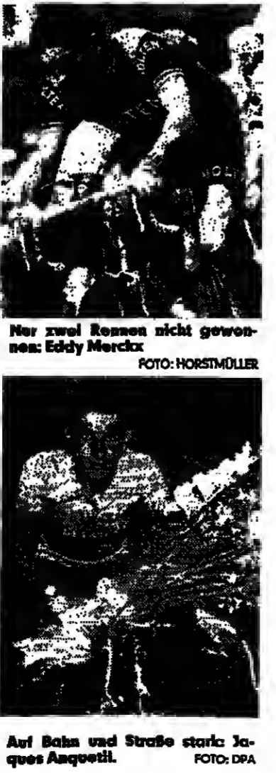
Auf Bahn und Straße stark: Jacques Anquetil.